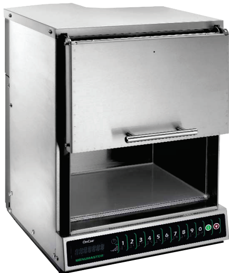
MOC24 mostrado com a porta aberta